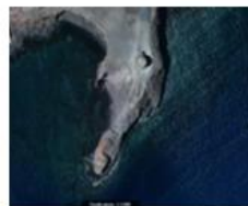
Torre de la Coloradas.