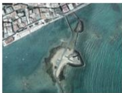
Castillo de San Gabriel.