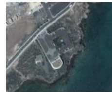
Museo Internacional de Arte Contemporáneo. MIAC.