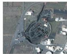
Jardín de Cactus.