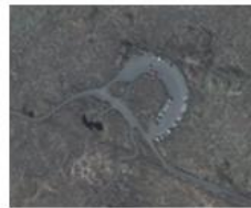
Cueva de los Verdes.