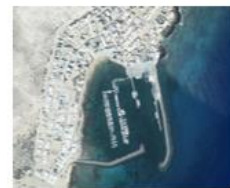
Paseo Marítimo Caleta de Sebo. La Graciosa.