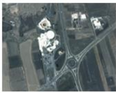
Casa-Museo del Campesino.