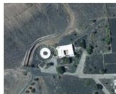
Casa Mayor Guerra.