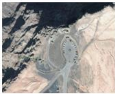
Mirador del Río.

Visto que Lanzarote es una isla pionera en la fusión de Arte, Cultura y Turismo, desde el COALZ proponemos que estas piezas puedan estar ubicadas en los exteriores de los CACT; así como en los exteriores de Edificios Históricos Patrimoniales de titularidad pública; con ello pretendemos que el Centro de Mejora de Calidad Turística conjugue Arte, Cultura, Turismo y Patrimonio. El COALZ aporta ejemplos de localización para que sirvan de referencia para el desarrollo de la propuesta de “Centro de mejora de la calidad turística” en las Islas de Lanzarote y la Graciosa (accesos exteriores de los Centro de Arte Cultura y Turismo (CACT) y/o Edificios con Valores Históricos Patrimoniales).