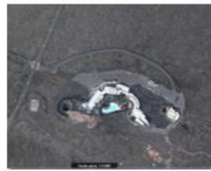
Jameos del Agua.