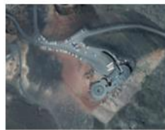
Montañas del Fuego.